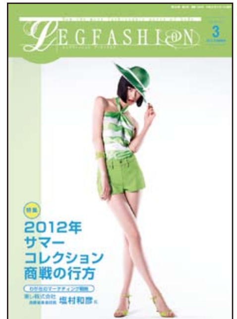
レグファッション アーティクルス3月号